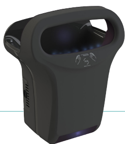
REF 8 11 1376 Automatischer Exp'air, schwarz Epoxid LE 1 : 1