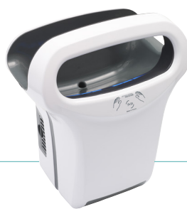
REF 8 11 791 Automatischer Exp'Air, Alu weiß Epoxid LE 1 : 1

+ REF 5 90 2014 Antibakterieller Kupferfilter LE 1 : 1