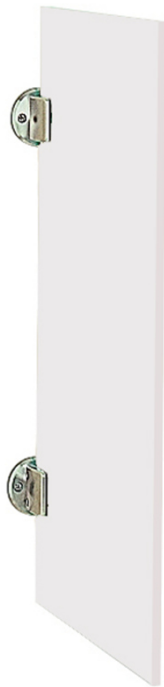
Technische Zeichnung für Urinaltrennwand aus ESG-Glas